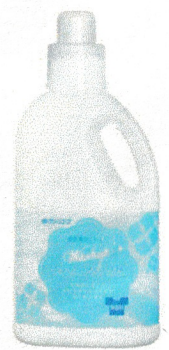
お洗濯のしゃぼん ウオッシュアップ液体 (800ml)