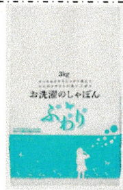
無香料 お洗濯のしゃぼん ふうり(キレート剤入)

せっけんカスが出るということはよく洗えていない状態です。 1回の洗濯の量を減らすか、洗剤の量を増やしてみてください。 せっけんカスも悪ではなく、タオルなどをふんわりさせる潤滑油の 効果も!うまく付き合って味方にしましょう。