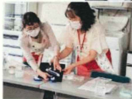
クイズ(上)で盛り上がり、実験(中)とパネルシアター(下)を見て、せっけんの知識が深まりました。

6/16(木)に東神戸支部主催で、組合員5名、ゲスト2名の参加、運営メンバー7名で行いました。無香料で食器にも使える洗濯用無添加せっけん(針状)でお茶碗などのつけ置き洗いをし、せっけん初心者とベテラン組合員の掛け合いのパネルシアターで、見ている方にも分かりやすくせっけんについて伝えることができました。実験を通して、せっけんと合成洗剤の違いやせっけんの魅力、炭酸塩、酸素系漂白剤の使い方、せっけんシャンプーのコツなどを伝えました。